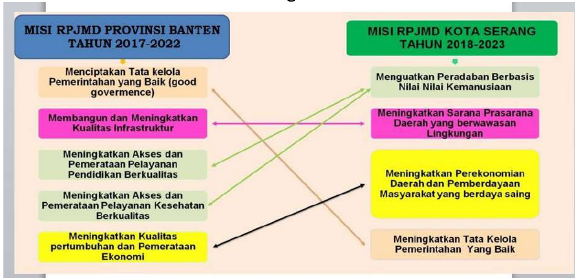
Gambar 3.3 Keterkaitan Misi RPJMD Provinsi Banten Tahun 2017-2022 dan RPJMD Kota Serang Tahun 2018-2023