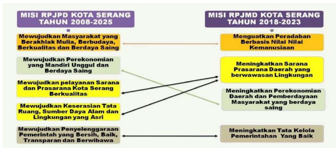
Gambar 3.1 Keterkaitan Misi RPJPD Kota Serang Tahun 2008-2025 dan RPJMD Kota Serang Tahun 2018-2023

Adapun keterkaitan misi masing masing dokumen perencanaan dari Misi RPJMN, RPJMD Provinsi Banten dan RPJPD Kota Serang dengan RPJMD Kota Serang Tahun 2018-2023 sebagai berikut :